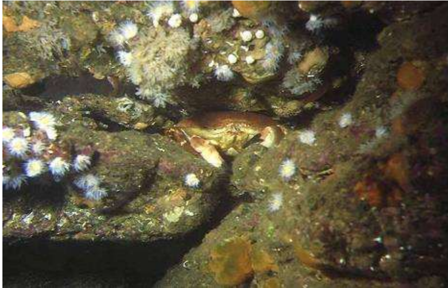
Crabe « dormeur » ou tourteau dans la roche

La visibilité est moyenne mais la densité de poissons compense et surprend. Dans certains lieux, vous chasserez les poissons pour distinguer l'épave ou la roche tant ils sont nombreux. Des bancs de « lieux » aux reflets argentés (parfois de plus d'un mètre), des « Saint Pierre » avec un peu de chance, des homards à tire larigot, des « tacauds » en bancs très denses, des « juliennes » et des congres joufflus, monstrueux, placides vous attendent.