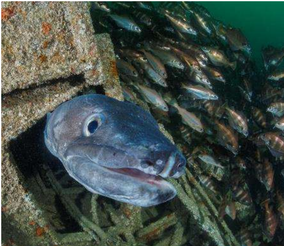
Le congre de service dans une épave

La visibilité est moyenne mais la densité de poissons compense et surprend. Dans certains lieux, vous chasserez les poissons pour distinguer l'épave ou la roche tant ils sont nombreux. Des bancs de « lieux » aux reflets argentés (parfois de plus d'un mètre), des « Saint Pierre » avec un peu de chance, des homards à tire larigot, des « tacauds » en bancs très denses, des « juliennes » et des congres joufflus, monstrueux, placides vous attendent.