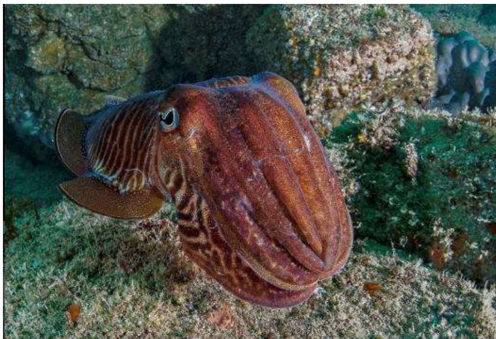
Une belle seiche, typique des fonds de St Cast

J'évoquerais aussi les « Banchenous », la « basse chrétienne », « les bourdinots », autant de jolies roches claires peu profondes avec plein de poisson, de la faune fixée et beaucoup d'attrait.